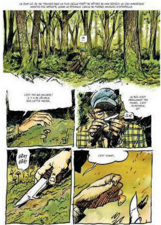
Dessins, couleurs, graphisme, mise en page : on peut passer des heures à tourner les pages de cet album !