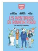
SERVICES DE PRESSE

Les Aventuriers du bonheur perdu. Collection BD Psy, 20 €, éditions Les Arènes.